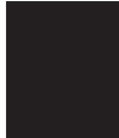
Fahrdraht Contact wire

Before beginning the construction work, please read through these instructions carefully and thoroughly. Take the work slowly, step by step, making sure that everything is to your satisfaction before proceeding.