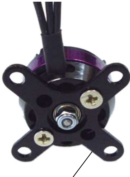
Rückwandbefestigung mit Alu-Stern Backmount with Alu-Star