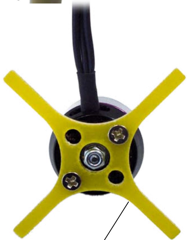
Rückwandbefestigung mit GfK-Stern Backmount with Fiberglas-Star