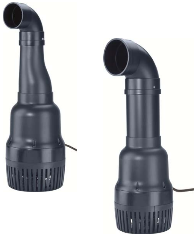
Pumpenkennlinien FIAP Aqua Active Power