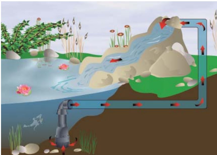
Pumpenkennlinien FIAP Aqua Active Power