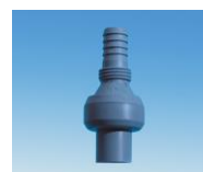
Rückschlagventil mit Entlüftung / non-return- valve with venting 3004.53.00