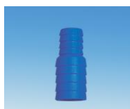
Entlüftungsstutzen / vent connection C1.0605.01