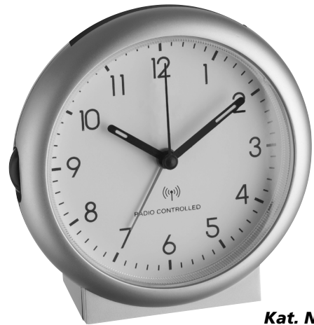
Kat. Nr. 98.1036