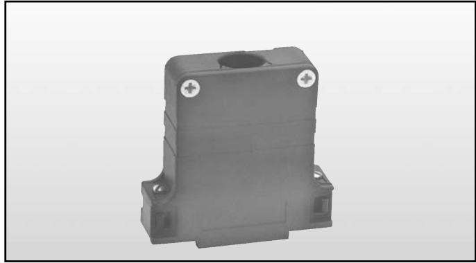
Kunststoffgehäuse mit geradem Kabelausgang großer Innenraum