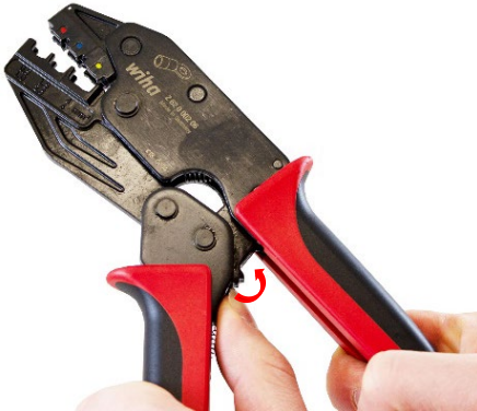
7.1 Rasthebel der Zwangssperre nach oben drücken. Push the locking lever of the ratchet release upwards.

Das Werkzeug kann bei falscher Handhabung vorzeitig entriegelt werden: In case of incorrect handling the tool can be released prematurely: