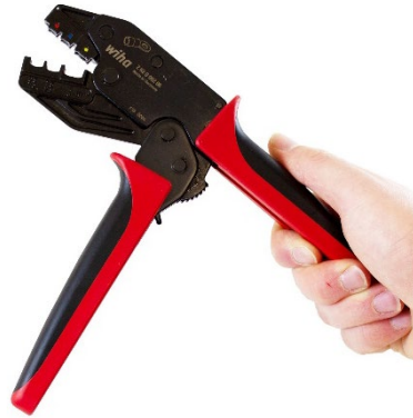
7.2 Werkzeug öffnet sich selbständig. Tool opens automatically.