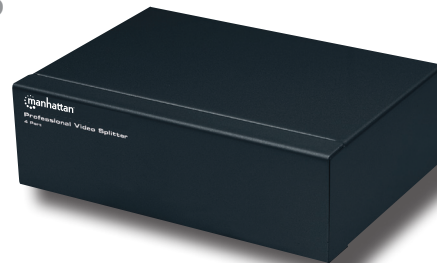
Model 207348, 4-Port