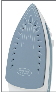
Kratzfeste und leichtgängige Keramiksohle

5 Funktionen: Sprüheinrichtung Dampfstoss Vertikaldampf Trockenfunktion Selbstreinigung