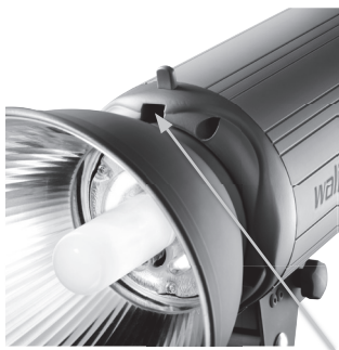
Openings for reflector and protection cap

Make sure not to touch the flash tube with bare hands accidentally.