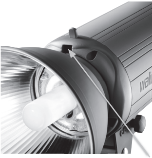
Einstecköffnungen für Reflektor bzw. Schutzkappe

Achten Sie darauf, dass Sie die Blitzröhre nicht versehentlich mit bloßen Händen berühren.