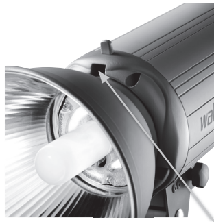
Einstecköffnungen für Reflektor bzw. Schutzkappe

Achten Sie darauf, dass Sie die Blitzröhre nicht versehentlich mit bloßen Händen berühren.