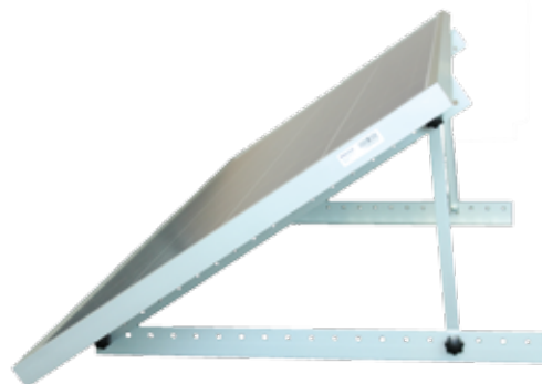
Mono Axial Two