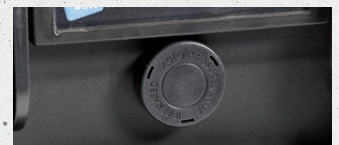
autom. Druckausgleichsventil auto air pressure compensation valve