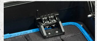
Clipsystem clip system