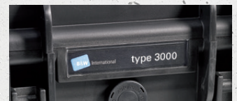
Eigentumskennzeichnung möglich name plate possible