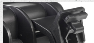
leichtgängiger Verschluss smooth latch