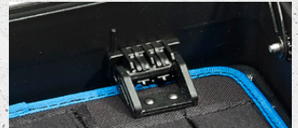
Clipsystem clip system