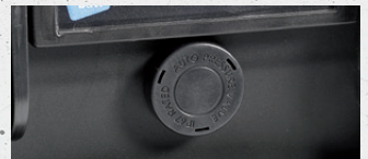
autom. Druckausgleichsventil auto air pressure compensation valve