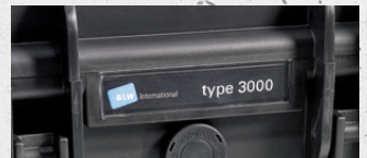
Eigentumskennzeichnung möglich name plate possible