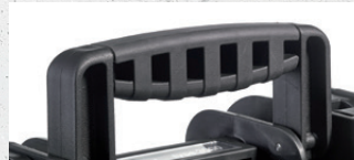
ergonomischer Griff ergonomic handle