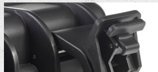
leichtgängiger Verschluss smooth latch