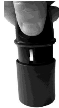
Drücken Sie den Stecker bündig in das Übergangsstück Enfoncez la fiche entièrement dans l'adaptateur Premere la spina completamente nell'adattatore