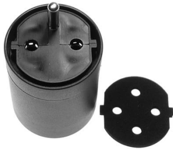
Übergangsstück CEE7-SEV Typ 12 mit Dichtung Adaptateur CEE7-SEV type 12 avec joint et cloche Adattatore CEE7-SEV Tipo 12 con la guarnizione