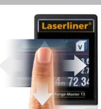
Touchdisplay zur Funktionsumschaltung