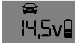
12V – Standard