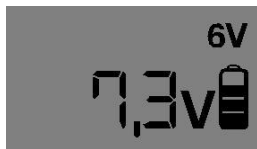
6V – Standard (Στάνταρ)