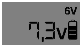
6V – Standard Lade-Betriebsart