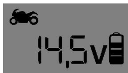
12V – “Soft” λειτουργίας)