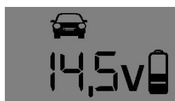
12V – “Wintermode”