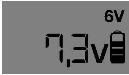
6V – Standaard