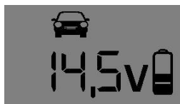
12V – Standard Lade-Betriebsart