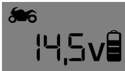
12V – “Soft“