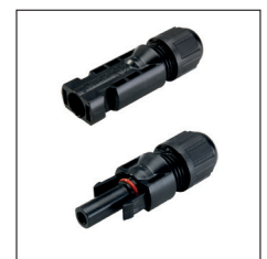
Standard4 connectors / Standard4 Verbinder

Find technical data on the next page. Technische Daten auf der nächsten Seite.