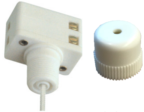
OMEG Zugschalter C200

Entsprechend RoHS (2011/65/EU) Prüfzeichen EN 61058-1