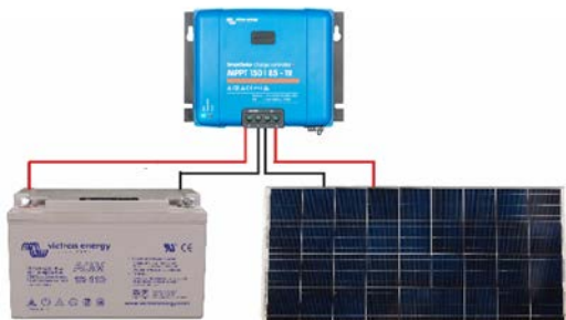
Figure 1: Power connections Illustration 1 : Connexions électriques Abbildung 1: Stromanschlüsse Figura 1: Conexiones de alimentación Bild 1: Strömanslutningar