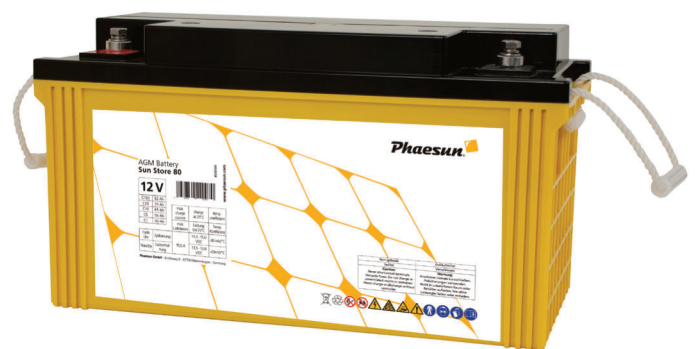
Sun Store 80

Die Phaesun Sun Store AGM Batterien sind sehr robust, wasserdicht, zyklusfest und haben eine lange Lebensdauer. Sie sind sehr effizient und am besten als Allround-Batterien geeignet.