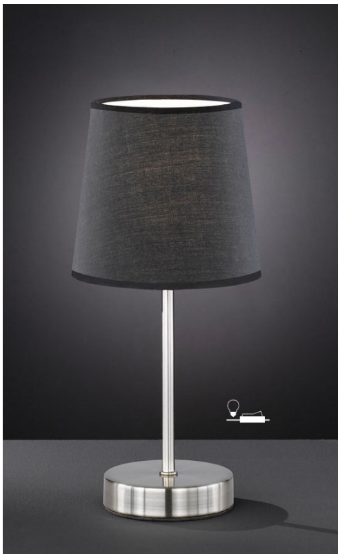
Wortmann & Filz GmbH · Im Langel 6 · 59872 Meschede-Freienohl Phone +49 (0) 29 03 / 449-0 · Fax +49 (0) 449-114 · www.wofi.de · info@wofi.de