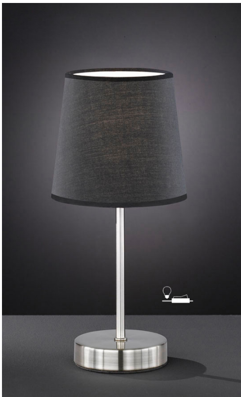
Wortmann & Filz GmbH · Im Langel 6 · 59872 Meschede-Freienohl Phone +49 (0) 29 03 / 449-0 · Fax +49 (0) 449-114 · www.wofi.de · info@wofi.de