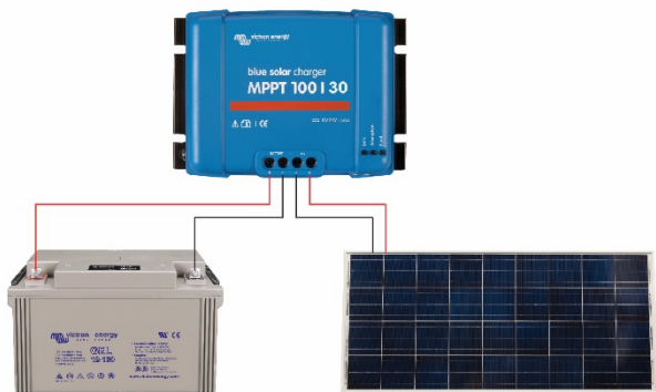
Figure 1: Power connections