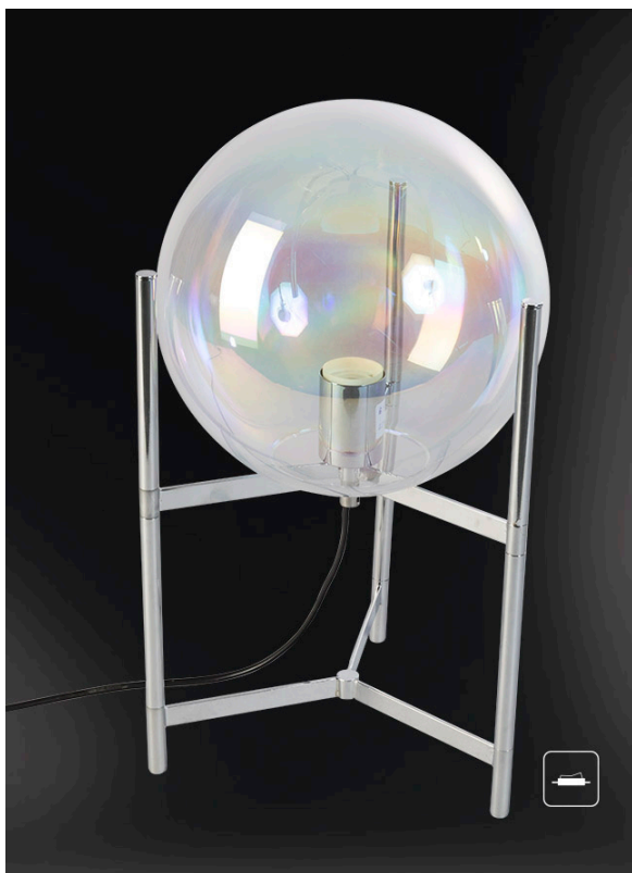
Wortmann & Filz GmbH · Im Langel 6 · 59872 Meschede-Freienohl Phone +49 (0) 29 03 / 449-0 · Fax +49 (0) 449-114 · www.wofi.de · info@wofi.de