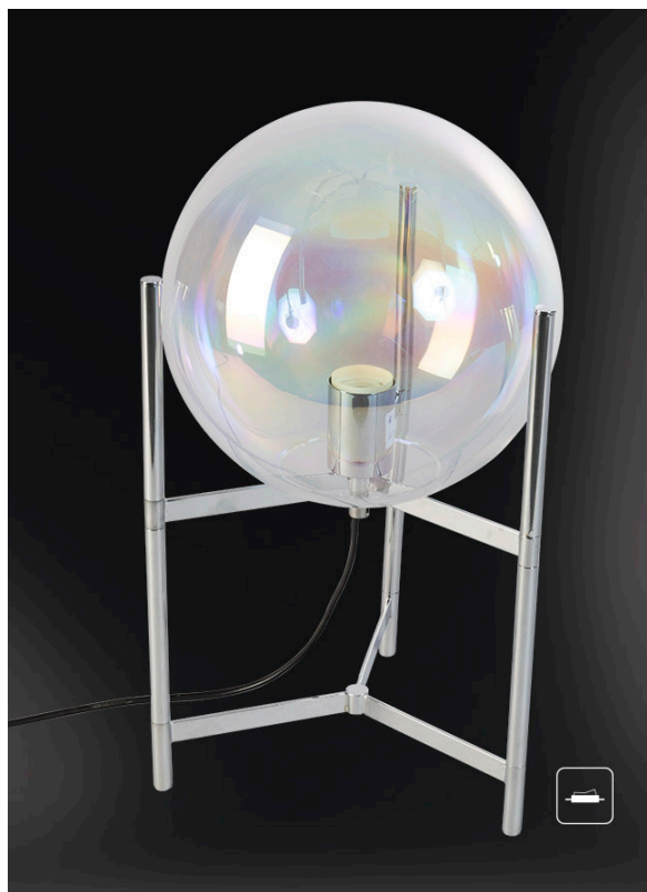
Wortmann & Filz GmbH · Im Langel 6 · 59872 Meschede-Freienohl Phone +49 (0) 29 03 / 449-0 · Fax +49 (0) 449-114 · www.wofi.de · info@wofi.de