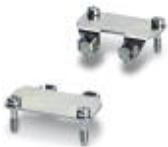
Adaptiereinsatz, Bauform: D25

Adaptiereinsatz - HC-CIF-D25-AIWS-SM-NI - 1424341