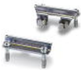
Adaptiereinsatz, Bauform: D15

Adaptiereinsatz - HC-CIF-D15-AIWS-SM-NI - 1424340