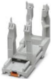
Tragschienen-Montagerahmen, Bauform: B6 - B24, für Kontakteinsätze

Bitte beachten Sie, dass die hier angegebenen Daten dem Online-Katalog entnommen sind. Die vollständigen Informationen und Daten entnehmen Sie bitte der Anwenderdokumentation. Es gelten die Allgemeinen Nutzungsbedingungen für Internet-Downloads. ( http://phoenixcontact.de/download )