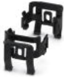
Verbindungselement, Bauform: B6 - B24

Verbindungselement - HC-CIF-B06-24-AEWL-PL-BK - 1424342