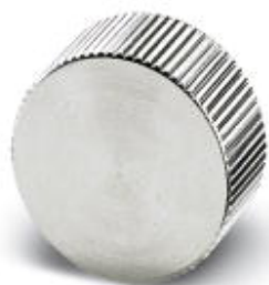
Metallschutzkappe für Steckverbinder, mit M17-Außengewinde

Bitte beachten Sie, dass die hier angegebenen Daten dem Online-Katalog entnommen sind. Die vollständigen Informationen und Daten entnehmen Sie bitte der Anwenderdokumentation. Es gelten die Allgemeinen Nutzungsbedingungen für Internet-Downloads. ( http://phoenixcontact.de/download )