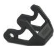
Ersatzbügel für HC-D7-Gehäuse