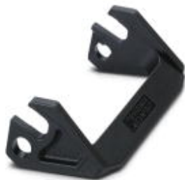
Ersatzlängsbügel für HEAVYCON-EVO-Gehäuse der Bauform B16, PA

Bitte beachten Sie, dass die hier angegebenen Daten dem Online-Katalog entnommen sind. Die vollständigen Informationen und Daten entnehmen Sie bitte der Anwenderdokumentation. Es gelten die Allgemeinen Nutzungsbedingungen für Internet-Downloads. ( http://phoenixcontact.de/download )