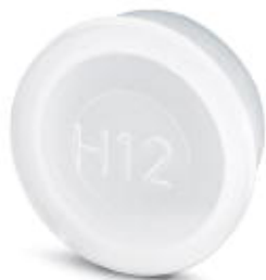
Kunststoffschutzkappe für Seckverbinder mit M23-Außengewinde

Bitte beachten Sie, dass die hier angegebenen Daten dem Online-Katalog entnommen sind. Die vollständigen Informationen und Daten entnehmen Sie bitte der Anwenderdokumentation. Es gelten die Allgemeinen Nutzungsbedingungen für Internet-Downloads. ( http://phoenixcontact.de/download )