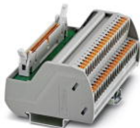
VARIOFACE-Übergabemodul für Siemens SIMATIC® S7-300, mit SIMATIC®-spezifischer Beschriftung (1-40), Push-in-Anschluss, Modulbreite: 107,9 mm

Bitte beachten Sie, dass die hier angegebenen Daten dem Online-Katalog entnommen sind. Die vollständigen Informationen und Daten entnehmen Sie bitte der Anwenderdokumentation. Es gelten die Allgemeinen Nutzungsbedingungen für Internet-Downloads. ( http://phoenixcontact.de/download )