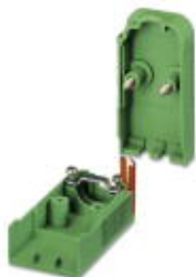
Kabelgehäuse, Rastermaß: 0 mm, Polzahl: 5, Maß a: 39,9 mm, Farbe: grün

Bitte beachten Sie, dass die hier angegebenen Daten dem Online-Katalog entnommen sind. Die vollständigen Informationen und Daten entnehmen Sie bitte der Anwenderdokumentation. Es gelten die Allgemeinen Nutzungsbedingungen für Internet-Downloads. ( http://phoenixcontact.de/download )