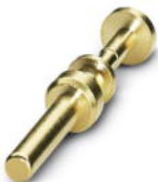
Crimpkontakt, gedreht, Einzelkontakt, Kontaktdurchmesser: 3,6 mm, Crimpbereich: 6 mm 2 ... 10 mm 2

Bitte beachten Sie, dass die hier angegebenen Daten dem Online-Katalog entnommen sind. Die vollständigen Informationen und Daten entnehmen Sie bitte der Anwenderdokumentation. Es gelten die Allgemeinen Nutzungsbedingungen für Internet-Downloads. ( http://phoenixcontact.de/download )