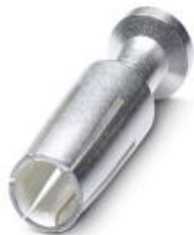
Gedrehter 4,0 er Crimpkontakt, Buchsent-Einzelkontakt, Aderquerschnitt 10 mm 2 , versilbert

Bitte beachten Sie, dass die hier angegebenen Daten dem Online-Katalog entnommen sind. Die vollständigen Informationen und Daten entnehmen Sie bitte der Anwenderdokumentation. Es gelten die Allgemeinen Nutzungsbedingungen für Internet-Downloads. ( http://phoenixcontact.de/download )