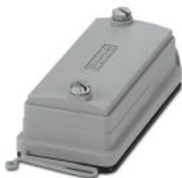
HEAVYCON ADVANCE, IP66, Schutzdeckel B10 für Anbauseite, mit Schraubverriegelung, mit Fangschnur, Durchmesser Fangschnuröse: 3 mm

Bitte beachten Sie, dass die hier angegebenen Daten dem Online-Katalog entnommen sind. Die vollständigen Informationen und Daten entnehmen Sie bitte der Anwenderdokumentation. Es gelten die Allgemeinen Nutzungsbedingungen für Internet-Downloads. ( http://phoenixcontact.de/download )