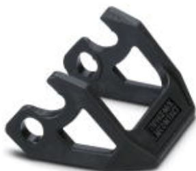
Ersatzquerbügel für HEAVYCON-EVO-Gehäuse, HC-B10 / HC-B16/ HC-B24, PA

Bitte beachten Sie, dass die hier angegebenen Daten dem Online-Katalog entnommen sind. Die vollständigen Informationen und Daten entnehmen Sie bitte der Anwenderdokumentation. Es gelten die Allgemeinen Nutzungsbedingungen für Internet-Downloads. ( http://phoenixcontact.de/download )