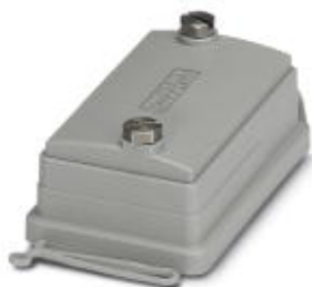
HEAVYCON ADVANCE, IP66, Schutzdeckel B6 für Anbauseite, mit Schraubverriegelung, mit Fangschnur, Durchmesser Fangschnuröse: 3 mm

Bitte beachten Sie, dass die hier angegebenen Daten dem Online-Katalog entnommen sind. Die vollständigen Informationen und Daten entnehmen Sie bitte der Anwenderdokumentation. Es gelten die Allgemeinen Nutzungsbedingungen für Internet-Downloads. ( http://phoenixcontact.de/download )