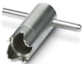
Spezialrohrschlüssel, Hilfswerkzeug zum Montieren der konfektionierbaren M23-Kabelsteckverbinder-Gehäuse

Bitte beachten Sie, dass die hier angegebenen Daten dem Online-Katalog entnommen sind. Die vollständigen Informationen und Daten entnehmen Sie bitte der Anwenderdokumentation. Es gelten die Allgemeinen Nutzungsbedingungen für Internet-Downloads. ( http://phoenixcontact.de/download )