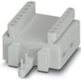
Höhenverlängerung für Geräteadapter Comfort, Breite: 45 mm

Bitte beachten Sie, dass die hier angegebenen Daten dem Online-Katalog entnommen sind. Die vollständigen Informationen und Daten entnehmen Sie bitte der Anwenderdokumentation. Es gelten die Allgemeinen Nutzungsbedingungen für Internet-Downloads. ( http://phoenixcontact.de/download )