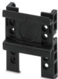
Tragschiene Comfort, zusätzliche Tragschiene für Geräteadapter Comfort

Bitte beachten Sie, dass die hier angegebenen Daten dem Online-Katalog entnommen sind. Die vollständigen Informationen und Daten entnehmen Sie bitte der Anwenderdokumentation. Es gelten die Allgemeinen Nutzungsbedingungen für Internet-Downloads. ( http://phoenixcontact.de/download )