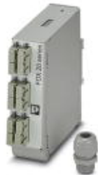
Box na spoje nosné lišty, bez pigtailů, pro 6x SC-Duplex

Upozorňujeme, že zde uvedené údaje pocházejí z online katalogu. Úplné informace a údaje naleznete v uživatelské dokumentaci. Platí všeobecné podmínky použití pro stahování z internetu. ( http://phoenixcontact.de/download )