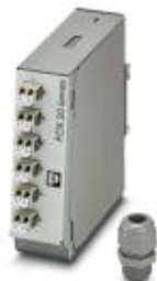
Box na spoje nosné lišty, bez pigtailů, pro 6x LC-Duplex

Upozorňujeme, že zde uvedené údaje pocházejí z online katalogu. Úplné informace a údaje naleznete v uživatelské dokumentaci. Platí všeobecné podmínky použití pro stahování z internetu. ( http://phoenixcontact.de/download )