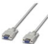
RS-232-Kabel, 9-polige D-SUB-Buchse auf 9-polige D-SUB-Buchse, 9-adrig, 1:1

Datenkabel - PSM-KA9SUB9/BB/2METER - 2799474