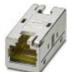
Gender Changer, RJ45 CAT 6A, Buchse / Buchse geschirmt