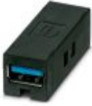
Gender Changer, USB 3.0, Bauform: A, Buchse / Buchse

Steckverbinder - VS-GC-USBA3-A-BUBU - 1055554