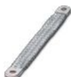
Masseband, Länge: 100 mm, für M4-Schrauben