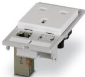
Zásuvka s ochranným kontaktem, plast, pro Anglii, vč. RJ45 měnič orientace (zásuvka/zásuvka, stíněno) CAT6A

Upozorňujeme, že zde uvedené údaje pocházejí z online katalogu. Úplné informace a údaje naleznete v uživatelské dokumentaci. Platí všeobecné podmínky použití pro stahování z internetu. ( http://phoenixcontact.de/download )