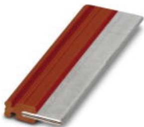
Steckbrücke, Länge: 50 mm, Farbe: rot

Bitte beachten Sie, dass die hier angegebenen Daten dem Online-Katalog entnommen sind. Die vollständigen Informationen und Daten entnehmen Sie bitte der Anwenderdokumentation. Es gelten die Allgemeinen Nutzungsbedingungen für Internet-Downloads. ( http://phoenixcontact.de/download )