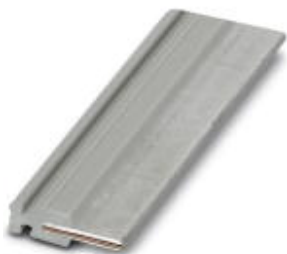
Steckbrücke, Länge: 50 mm, Farbe: grau

Bitte beachten Sie, dass die hier angegebenen Daten dem Online-Katalog entnommen sind. Die vollständigen Informationen und Daten entnehmen Sie bitte der Anwenderdokumentation. Es gelten die Allgemeinen Nutzungsbedingungen für Internet-Downloads. ( http://phoenixcontact.de/download )