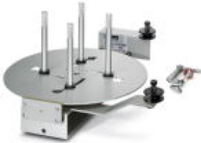
Kabelroller für CUTFOX 10

Bitte beachten Sie, dass die hier angegebenen Daten dem Online-Katalog entnommen sind. Die vollständigen Informationen und Daten entnehmen Sie bitte der Anwenderdokumentation. Es gelten die Allgemeinen Nutzungsbedingungen für Internet-Downloads. ( http://phoenixcontact.de/download )