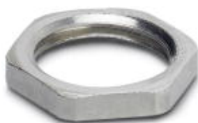
Flachmutter mit M14-Gewinde

Bitte beachten Sie, dass die hier angegebenen Daten dem Online-Katalog entnommen sind. Die vollständigen Informationen und Daten entnehmen Sie bitte der Anwenderdokumentation. Es gelten die Allgemeinen Nutzungsbedingungen für Internet-Downloads. ( http://phoenixcontact.de/download )