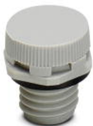
Druckausgleichselement, Material Verschraubung: Polyamid, Anschlussgewinde: M12 x 1,5, Farbe: lichtgrau, mit O-Ring

Bitte beachten Sie, dass die hier angegebenen Daten dem Online-Katalog entnommen sind. Die vollständigen Informationen und Daten entnehmen Sie bitte der Anwenderdokumentation. Es gelten die Allgemeinen Nutzungsbedingungen für Internet-Downloads. ( http://phoenixcontact.de/download )